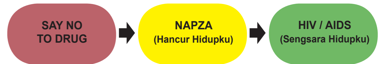
Gambar 2 Alur isi Modul 4 unit 3 NAPZA unit 5 HIV/AIDS

Selain NAPZA bahaya yang mengintai remaja sekarang yaitu HIV/AIDS (unit 4) karena penularannya yang sangat riskan dan berbahaya. Dengan adanya modul ini diharapkan remaja dapat mengetahui bahaya dari HIV/AIDS dan mencegah HIV/AIDS.